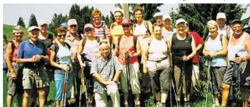
Freuen sich auf den Sommer: Die wanderfreudige Schwyzler Senioren-Langlaufgruppe im letzten Jahr auf der Gueteregg oberhalb von Willerzell.